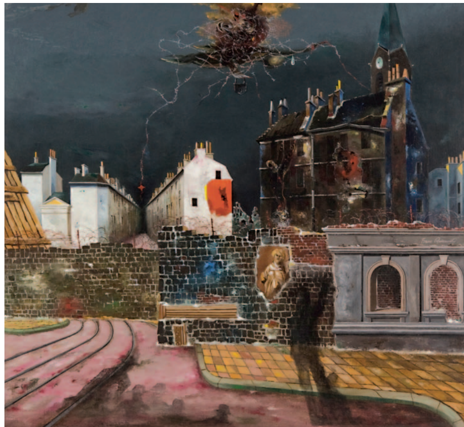
Die Berliner Mauer, Ölgemälde, 1962, Berlinische Galerie, Berlin