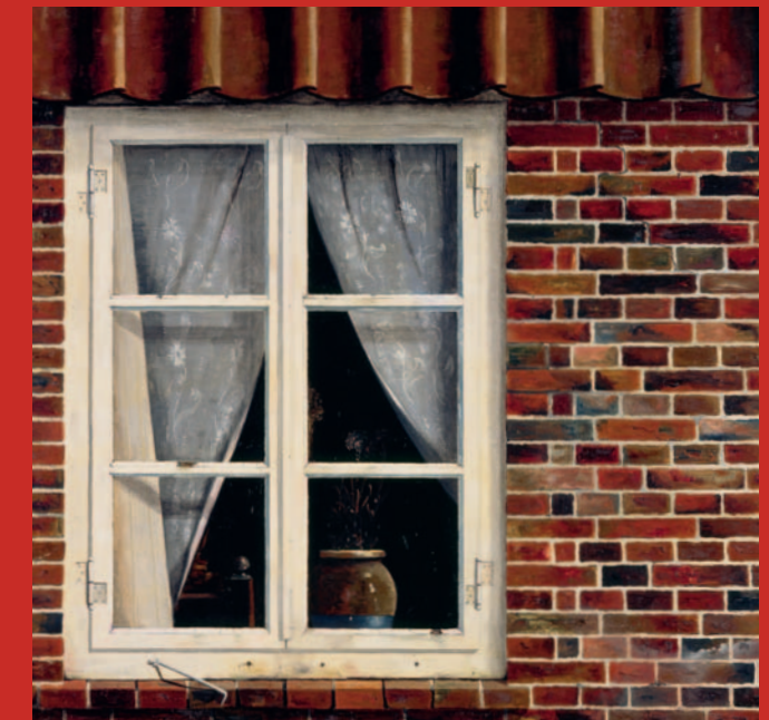
Franz Radziwill, Das Fenster meines Nachbarn, 1930, Landesmuseum Oldenburg

Anlässlich des 125. Geburtstags des Künstlers widmet das Landesmuseum Oldenburg dem Meister des Magischen Realismus eine Retrospektive. Erstmals zeigt es den gesamten, über Jahrzehnte gewachsenen Bestand an Werken des Malers und macht somit das Lebenswerk des Künstlers anschaulich: Von den radikalen, expressionistischen Frühwerken über die Hinwendung Radziwills zur Magie der „Wirklichkeit“ bis zum Aufgreifen von Motiven des Surrealismus im Spätwerk.