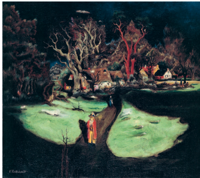
Landschaft mit großem Schatten, Ölgemälde, 1923, Privatbesitz

Als bildnerisches Stilmittel entdeckte Franz Radziwill das Licht im Jahr 1923 – nach seiner Abkehr vom Expressionismus. Erstes Zeugnis seines Interesses an Beleuchtungseffekten ist das frühe Gemälde „Landschaft mit großem Schatten“, das in frühen Ausstellungen noch den Titel „Landschaft mit Lichtfleck“ trug. Zur Entstehungszeit des Werkes hatte sich Radziwill gerade in Dangast niedergelassen. Fernab der elektrifizierten Städte konnte er das Wetterleuchten und den Lauf von Sonne und Mond