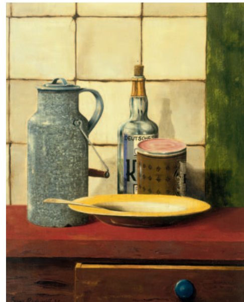
Stillleben mit gelbem Teller, Ölgemälde, 1931, Privatbesitz